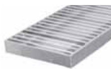
Příčně žebrovaný rošt pro RB 130, 230