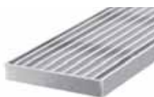
Podélně žebrovaný rošt pro RB 130, 230