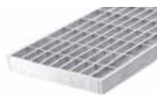
Mřížkový rošt MW 30/10 pro RB 130, 230