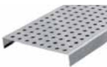
Děrovaný rošt pro RB 130, 230