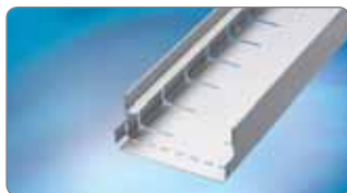
BG-FA RB 130