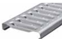
Chodníkový rošt pro RB 130